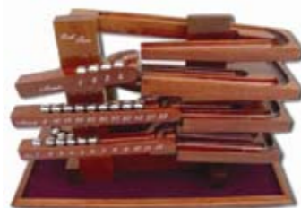
Ball Time de madeira